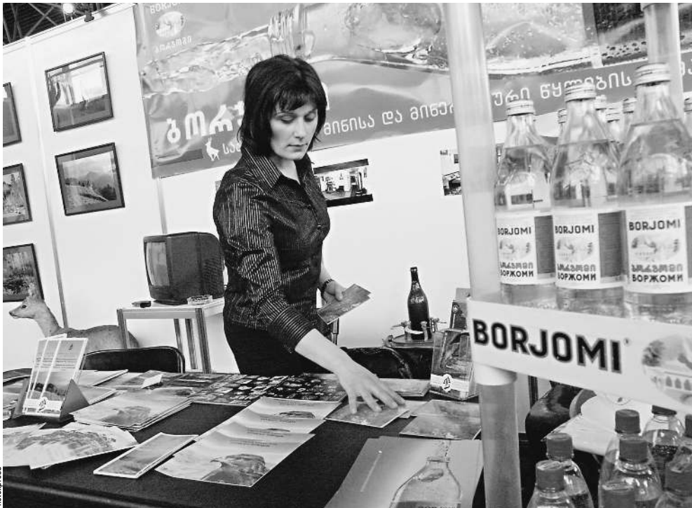
После 15 лет эмбарго грузинское «Боржоми» может вернуться на российский рынок. Но многие эксперты не уверены, что это возвращение станет триумфальным и знаменитая вода вернет себе былые 15% рынка.