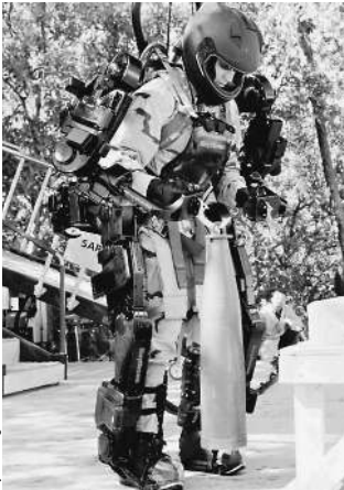
Реинкарнация Робокопа обойдется бюджету в 200 млн

На прошлой неделе Минобрнауки объявило конкурс на разработку программно-аппаратного комплекса «Экзоскелетон» стоимостью 194 млн рублей. Внешне разработка должна напоминать шагающих человекоподобных роботов, знакомых нам по голливудским фильмам. Человек становится в центр машины, и гигантские конечности робота повторяют его движения. Что-то подобное попытаются разработать отечественные конструкторы.