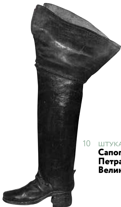
10 ШТУКА Сапог Петра Великого