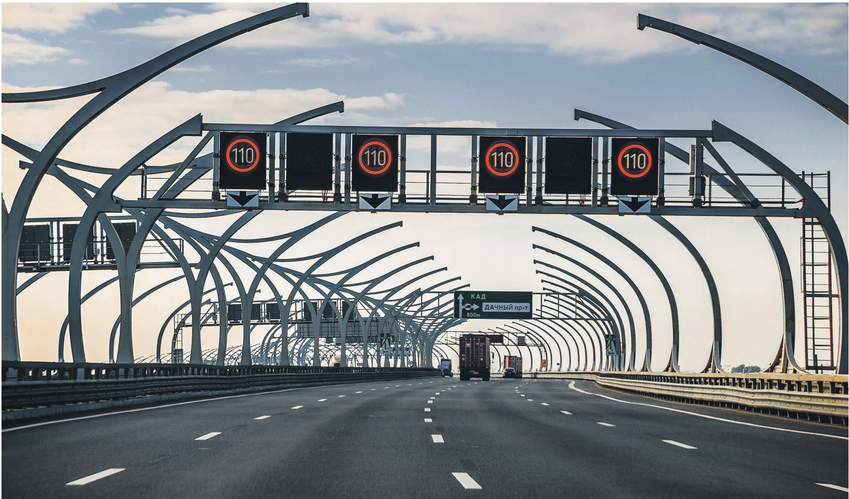
Для развития транспортной инфраструктуры и других крупных объектов нужны особые стимулы, считают в Минфине

Для решения проблемы необходимо вмешательство государства для создания новых условий нормативно-правового регулирования, считают в ведомстве. Основная цель предлагаемых новаций — не допустить, что-