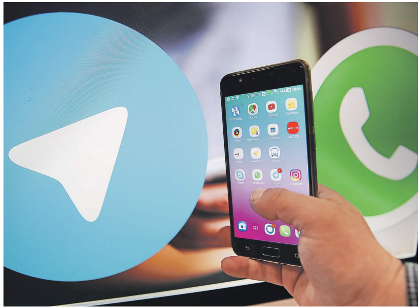
Сотовые операторы будут собирать информацию о том, в каких мессенджерах переписываются клиенты