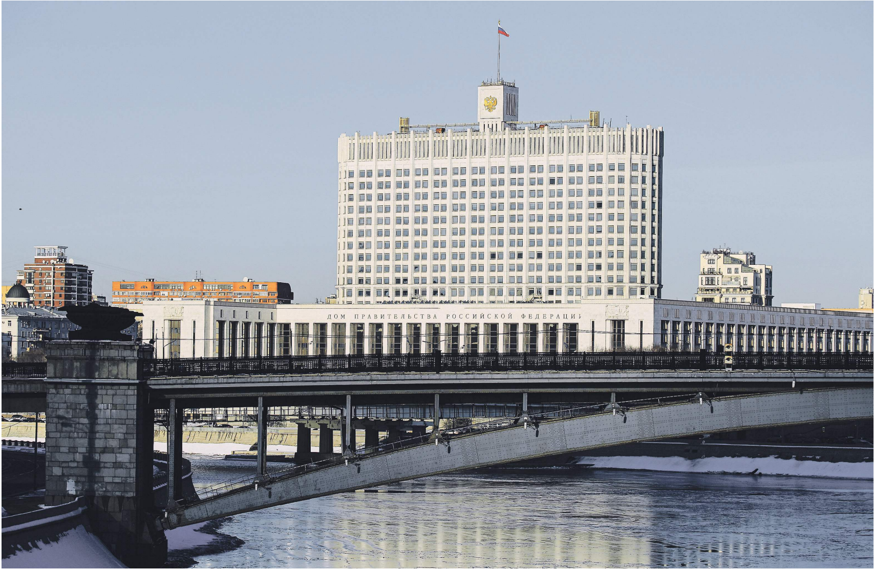
Правительство планирует осуществить реформу надзора и контроля за семь лет | Михаил Терещенко | «Известия»