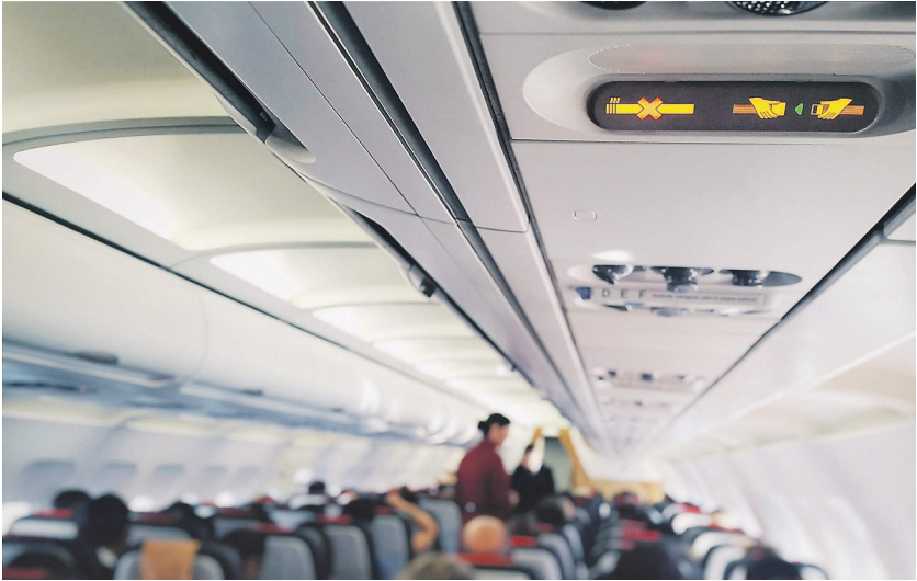
За невыполнение законных распоряжений командира воздушного судна предлагается штраф в 20–40 тыс. рублей

Штраф за дебош в самолете может быть увеличен в десять раз, его размер будет достигать 20–40 тыс. рублей. Кроме того, может появиться и отдельное наказание за мелкое хулиганство на транспорте с взысканием от 30 тыс. до 50 тыс. рублей. Соответствующие поправки к Кодексу об административных правонарушениях намерена поддержать сегодня правительственная комиссия по законопроектной работе. Документ уже согласован с Минтрансом, Следственным комитетом, Генпрокуратурой и государственно-правовым управлением президента РФ. В МВД проект раскритиковали, а юристы увидели в нем коррупционные риски. Правительственная комиссия по законопроектной деятельности в понедельник планирует рассмотреть и поддержать поправки к КоАП РФ от Минюста, усиливающие наказание за противоправные действия на борту самолета («Известия» озна-