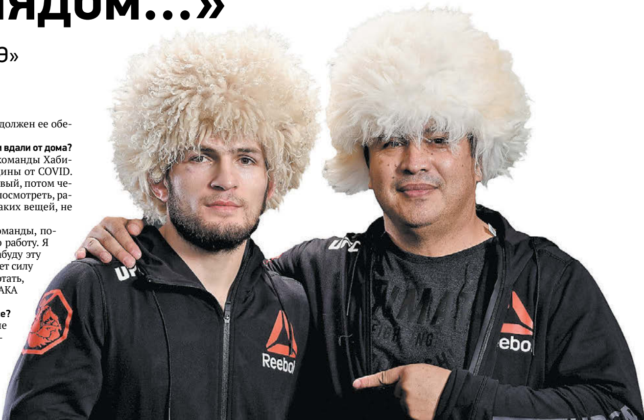
Хабиб Нурмагомедов и Хавьер Мендес