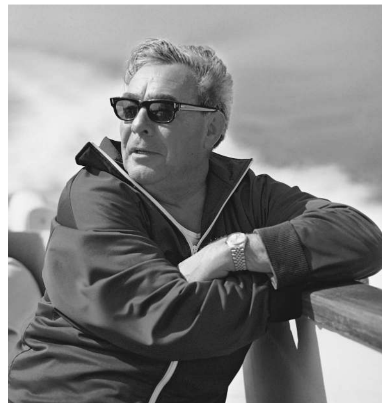
Леонид Брежнев на этом фото себя сравнивал с АЛЕНОМ ДЕЛОНОМ . Эта фотосессия ему очень нравилась, но советский народ такого генсека так и не увидел — она была напечатана только за границей

Сам он скромный, интеллигент и всегда спокоен. Несуетлив. → стр. 15