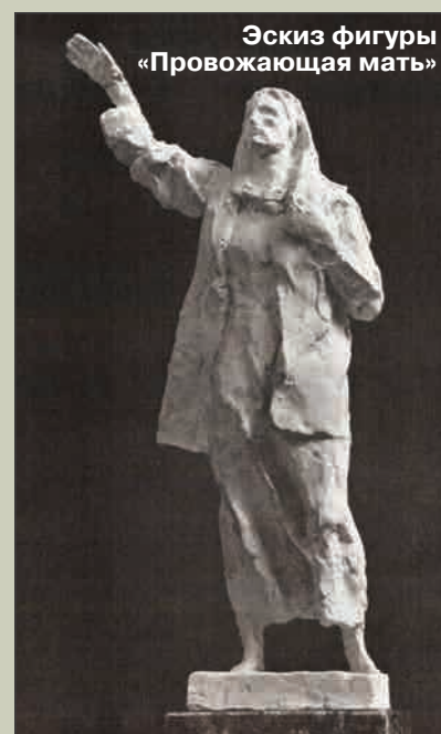
Эскиз фигуры «Провожаящая мать»