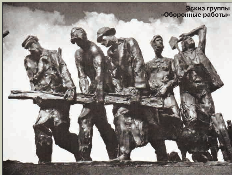
Эскиз группы «Оборонные работы»