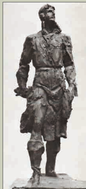
Эскиз фигуры лётчика к группе «Лётчики и моряки»