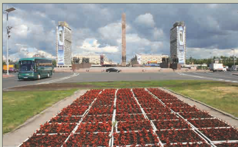
Вид со стороны Пулковского шоссе