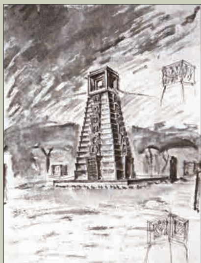
И.М.Чайко. Проект памятника героическим защитникам Ленинграда 1942—1943 гг.

монумента в честь подвига защитников Ленинграда