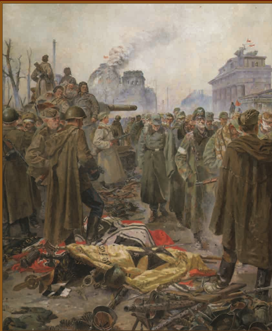
Капитуляция Берлина Художник П.А. Кривоногов, 1946 г.

9 мая — День Победы советского народа в Великой Отечественной войне 1941—1945 гг. День воинской славы России