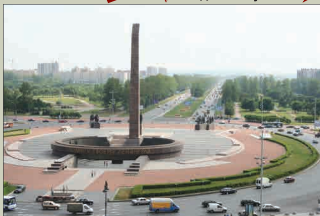
Вид на монумент