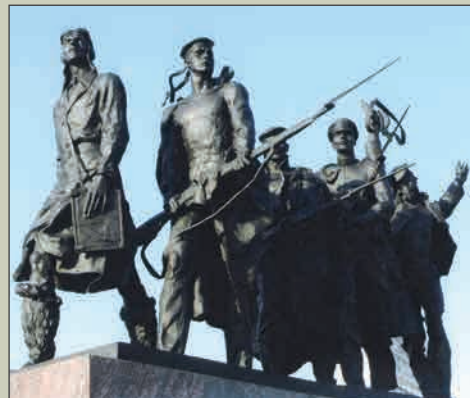
Скульптурная группа «Лётчики и моряки»