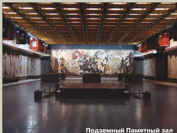
Подземный Памятный зал