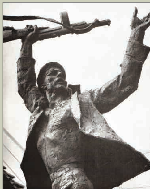
Фрагмент группы «Лётчики и моряки»