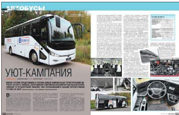
YUTONG ZK 6947 H