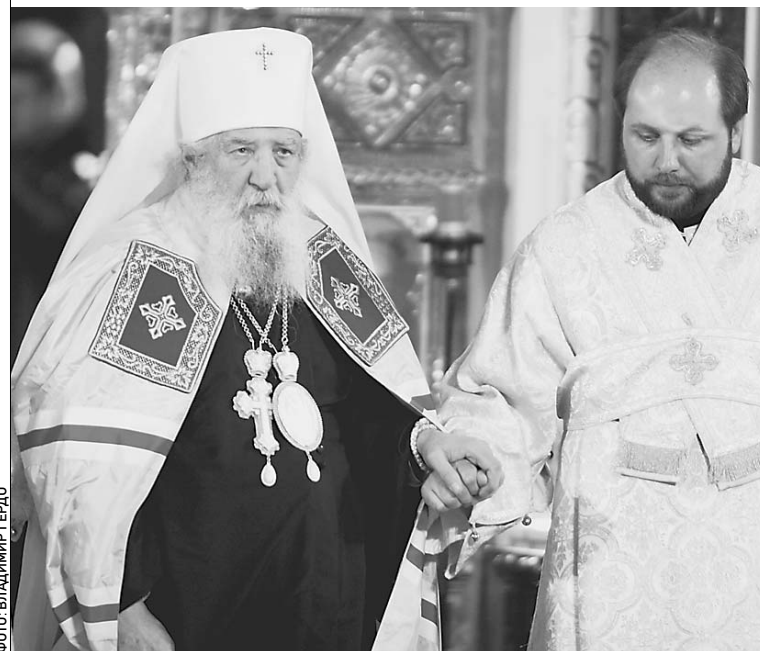
Митрополит Лавр вошел в историю Церкви

— Он еще был епископом, а я членом духовной миссии Русской православной церкви в Иерусалиме. Он уже в ту пору видел в нас священнослужителей, а не «агентов КГБ». Меня всегда поражали его простота и смирение. И в Иерусалиме, когда он подходил к Гробу Господню, не «выставлял» себя как епископа, и позже, в Москве, когда он стоял среди постоянных членов Священного синода. А ведь он все-таки первоиерарх! → стр. 2