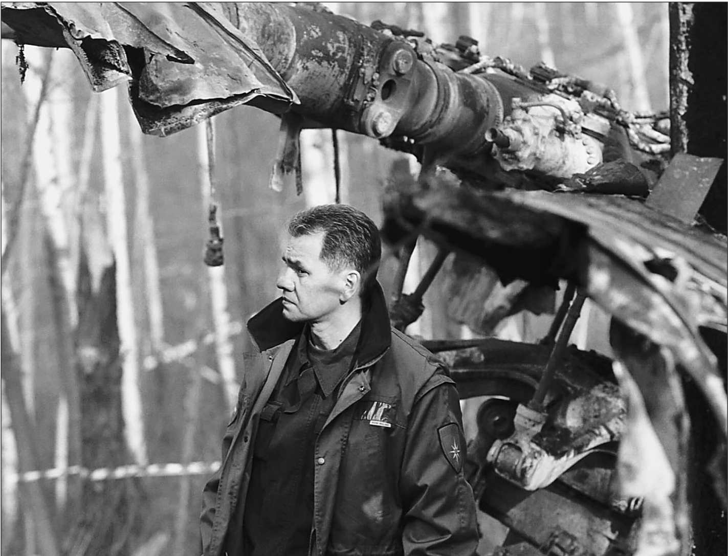
Читинская область. Министр по чрезвычайным ситуациям Сергей Шойгу на месте падения Ми-26

ное устройство, из-за сильного ветра зацепились за хвостовой винт вертолета, — заявил глава МЧС Сергей Шойгу, который побывал в Читинской области. — Вертолет потерял управление и упал. Данную версию подтверждает тот факт, что на месте падения Ми-26 обнаружен хвостовой винт с намотанным на него тросом. Окончательную причину катастрофы назовет военная прокуратура, которая завела уголовное дело. Но уже сейчас возникают простые вопросы: существует ли безопасная и отработанная технология ту-