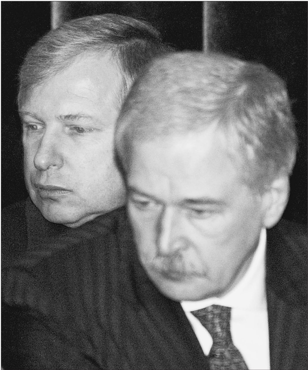
12 марта. Виктор Черкесов (слева) и Борис Грызлов впервые присутствовали на совещании силовиков в Генпрокуратуре как коллеги

ет, что часть структуры ФСНП перейдет к МНС. Именно по данным МНС полицейские заводили большинство уголовных дел, связанных с неуплатой налогов. «Мы по-прежнему будем давать наводку силовикам на потенциальных нарушителей», — сказал «Известиям» источник в МНС. — Для нас разницы никакой не будет — теперь информация будет передаваться в МВД». Концентрация функций гособоронзаказа в руках Минобороны теоретически выглядит эффективно, однако в реальности вряд ли что быстро изменит. — Создание Госкомитета сможет сделать более понятным обо-