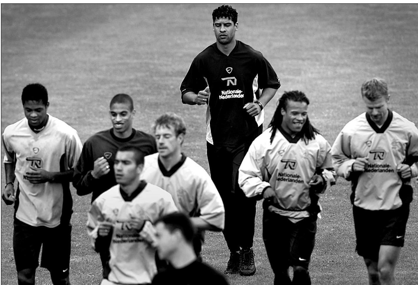
Вчера. Хендерлоо. Тренировка сборной Голландии. Франк РАЙКААРД (на дальнем плане) работает на равных со своими игроками: (слева направо) Патрик КЛЮЙВЕРТ, Михаэль РАЙЦИГЕР, Джованни ВАН БРОНKHORST, Берт КОНТЕРМАН, Эдгар ДАВИДС и Деннис БЕРГКАМП.