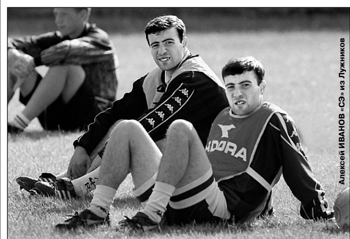
Вчера. Москва. Лужники. Тренировка «Торпедо». Суждено ли прибывшим на просмотр игрокам закрепиться в именитом столичном клубе?

Репортаж корреспондентов «СЭ» с тренировок «Торпедо» - стр. 5