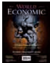
#4 (14) Illustration by Oleg Babkin