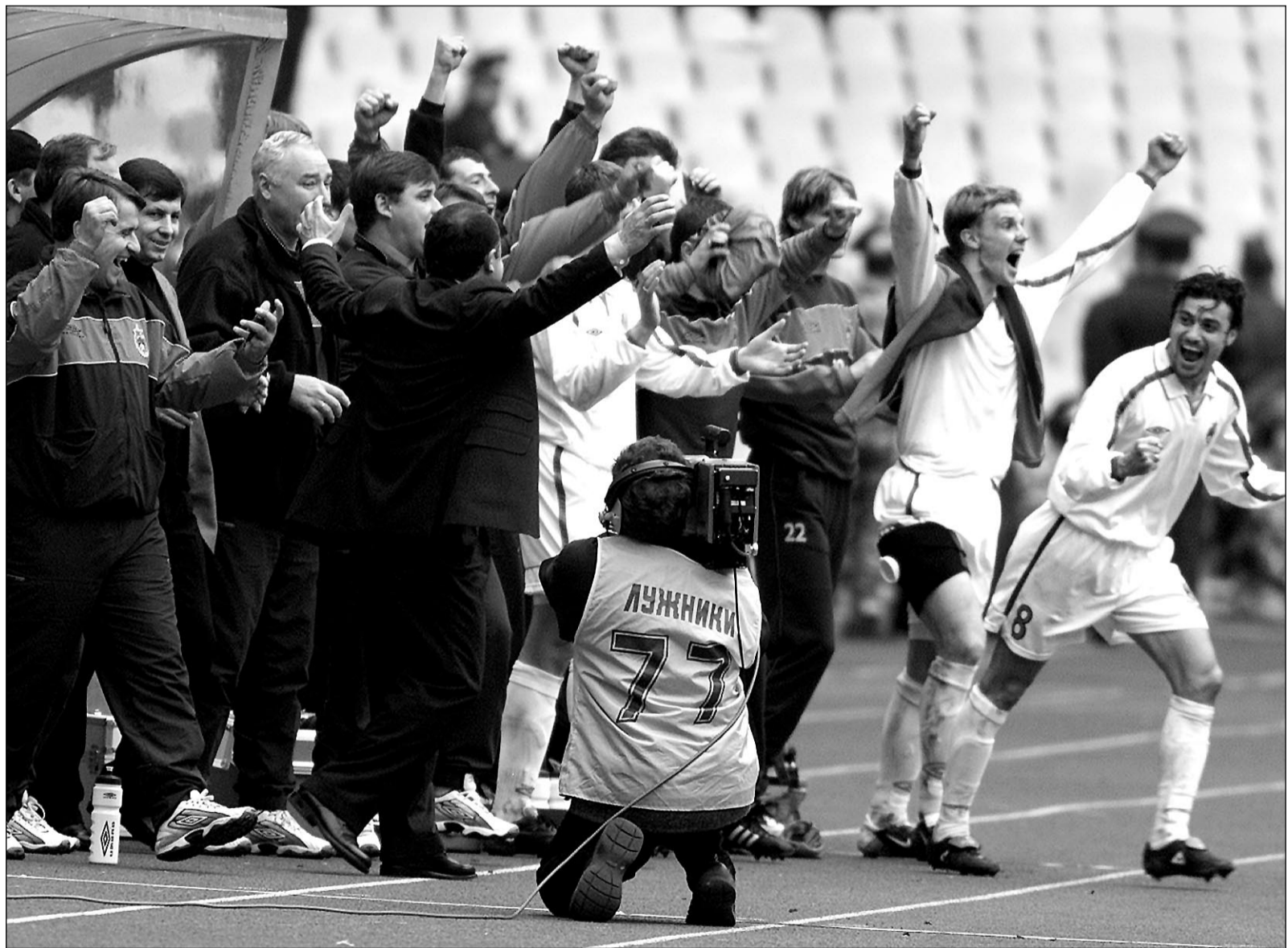
Финальная радость армейцев. Чемпионы России разгромлены – и сразу 10 футболистов ЦСКА попадают в символическую сборную тура по версии «СЭ».

В скобках – количество попаданий в символическую сборную «СЭ»