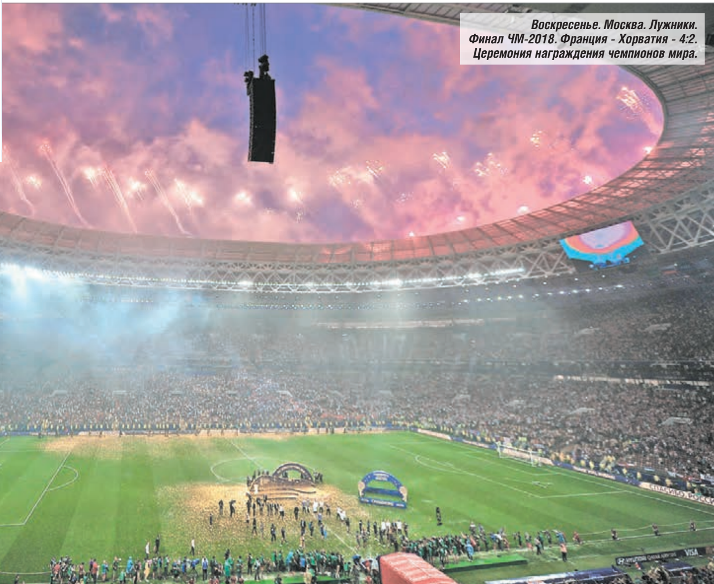
Воскресенье. Москва. Лужники. Финал ЧМ-2018. Франция - Хорватия - 4:2. Церемония награждения чемпионов мира.

Вчера генеральный директор оргкомитета «Россия-2018» стал гостем редакции «СЭ»