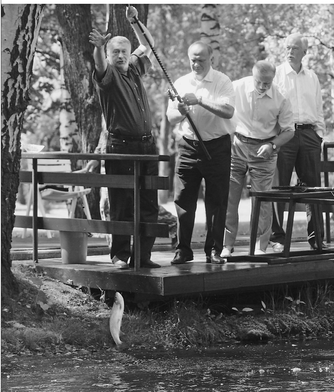
РЫБАЛКА — любимый вид отдыха депутатов Госдумы

Получив законные отпускные, многие думцы собираются на рыбалку