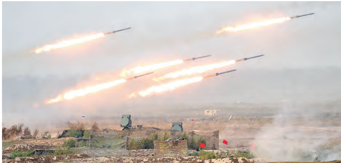
Мощный огонь ведут РСЗО «Торнадо-Г»

На учении был применён и опробован весь комплекс манёвров, которые ранее не рассчитывали с такой тщательностью временных интервалов, когда авиация, ракетные войска и артиллерия, наземные силы ПВО, танки и БМП осуществляли постоянное огневое воздействие, точно в соответствии с указанным временем.