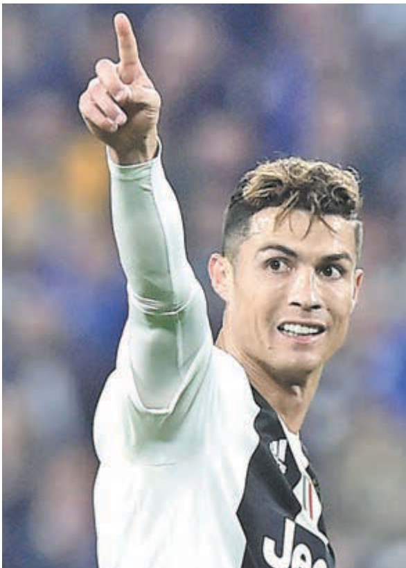
Нападающий «Ювентуса» Криштиану Роналду