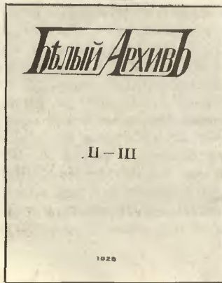
Материалы летописи революции.