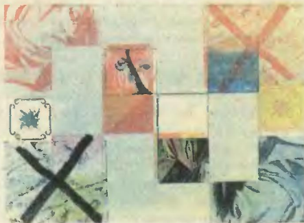
И. Чуйков. «Крестники-нолики».