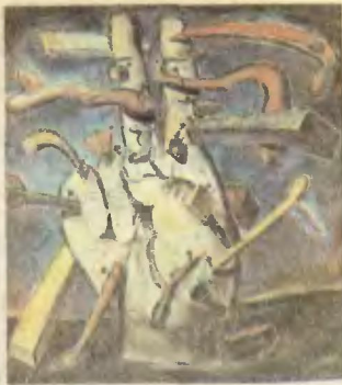
Г. И. Докупил. «Отдыхающая рука в окружении форм».

В этом номере вы прочтете о том, как в разные времена общество судило о себе самом; о пределах возможностей статистики; о самом удивительном животном на Земле; о том, как осваиваются архивы КПСС.