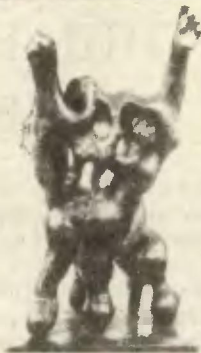
Ж. Липиш. «Радость Орфея».