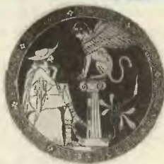
Эдип разгадывает загадку Сфинкса (рисунок на вазе).