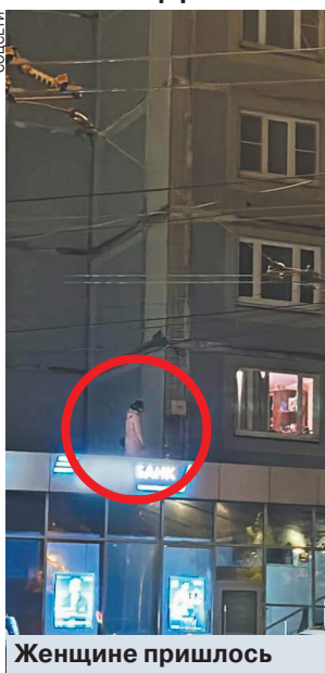
Женщине пришлось ждать на улице.

Мужа и жену из этой квартиры соседи знают как счастливых влюбленную пару. Молодые