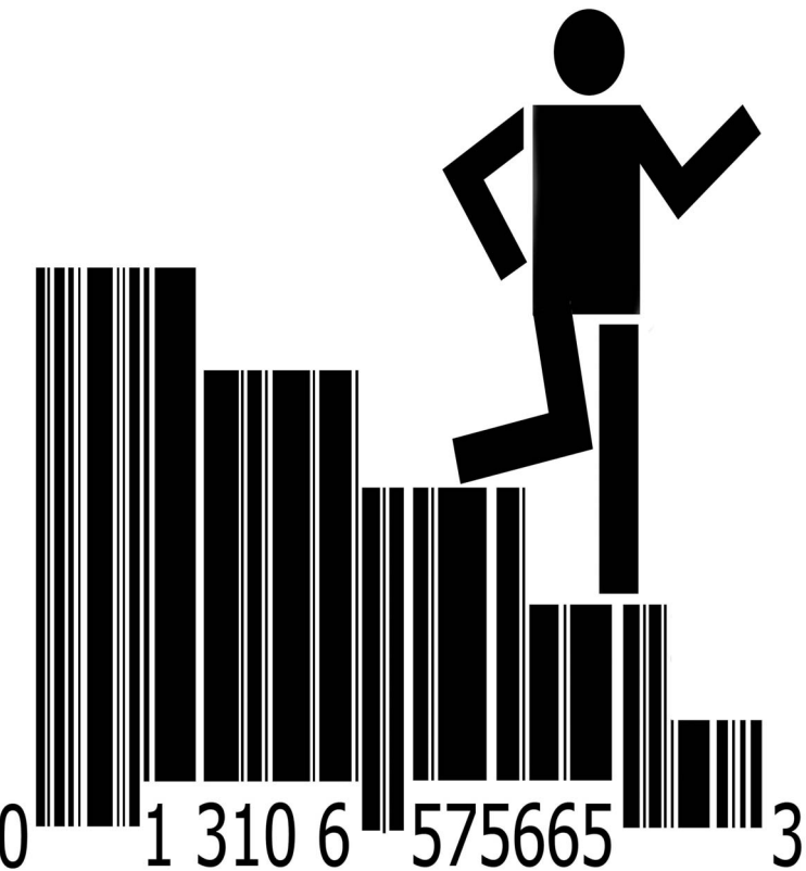
ИЛЛЮСТРАЦИЯ: КОНСТАНТИН БАЛОВ

И не мудрено. Американские фондовые индексы в пятницу потеряли около 3,5%, при этом значение Standard & Poor's 500 снизилось до минимума с апреля 2003 года. Российские биржи в пятницу откатились на уровень августа 2004 года. Поэтому их и закрыли до вторника. Может, и вообще открывать не стоит, задавались вчера вопросом финансисты. → стр. 7