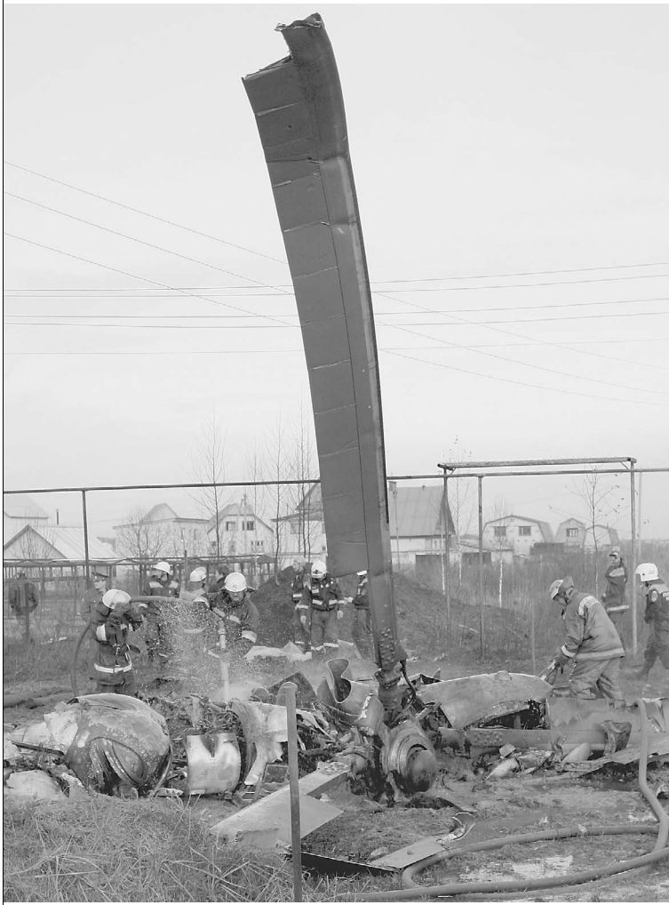
От удара о землю фюзеляж машины развалился. У летчиков не оставалось шансов выжить

Жители улицы Луговой в пригородном поселке Нижняя Тура до сих пор не могут прийти в себя от случившегося. → стр. 3