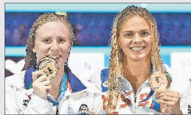
Александр ФЕДОРОВ «СЗ»

Юлия Ефимова заняла лишь третье место на стометровке брассом на чемпионате мира. В полуфинале она была в 0,01 секунды от мирового рекорда, но в решающем заплыве его установила принципиальная соперница россиянки - американка Лилли Кинг.