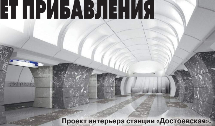
Проект интерьера станции «Достоевская».