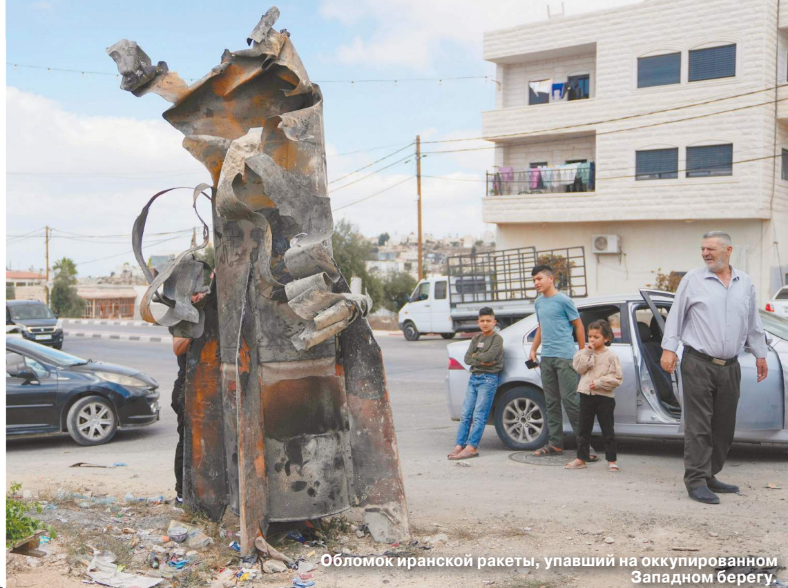
Обломок иранской ракеты, упавший на оккупированном Западном берегу.

Ближний Восток опять на пороге большой войны