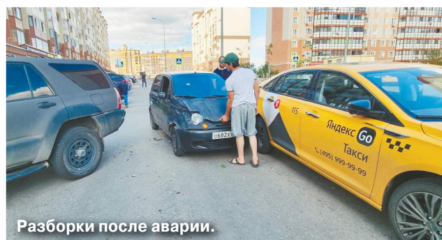
Разборки после аварии.

Отвечать за хулиганство, вероятнее всего, придется уроженцам Таджикистана, устроившим ДТП в июле этого года в городском округе Видное. После аварии мигранты стали невежливо выражаться в адрес женщины-водителя, а ее супруги хотели вызвать на разговор по-мужски.