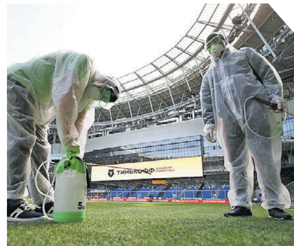
Дарья Исаева «СЭ» / Canon EOS-1D X Mark II