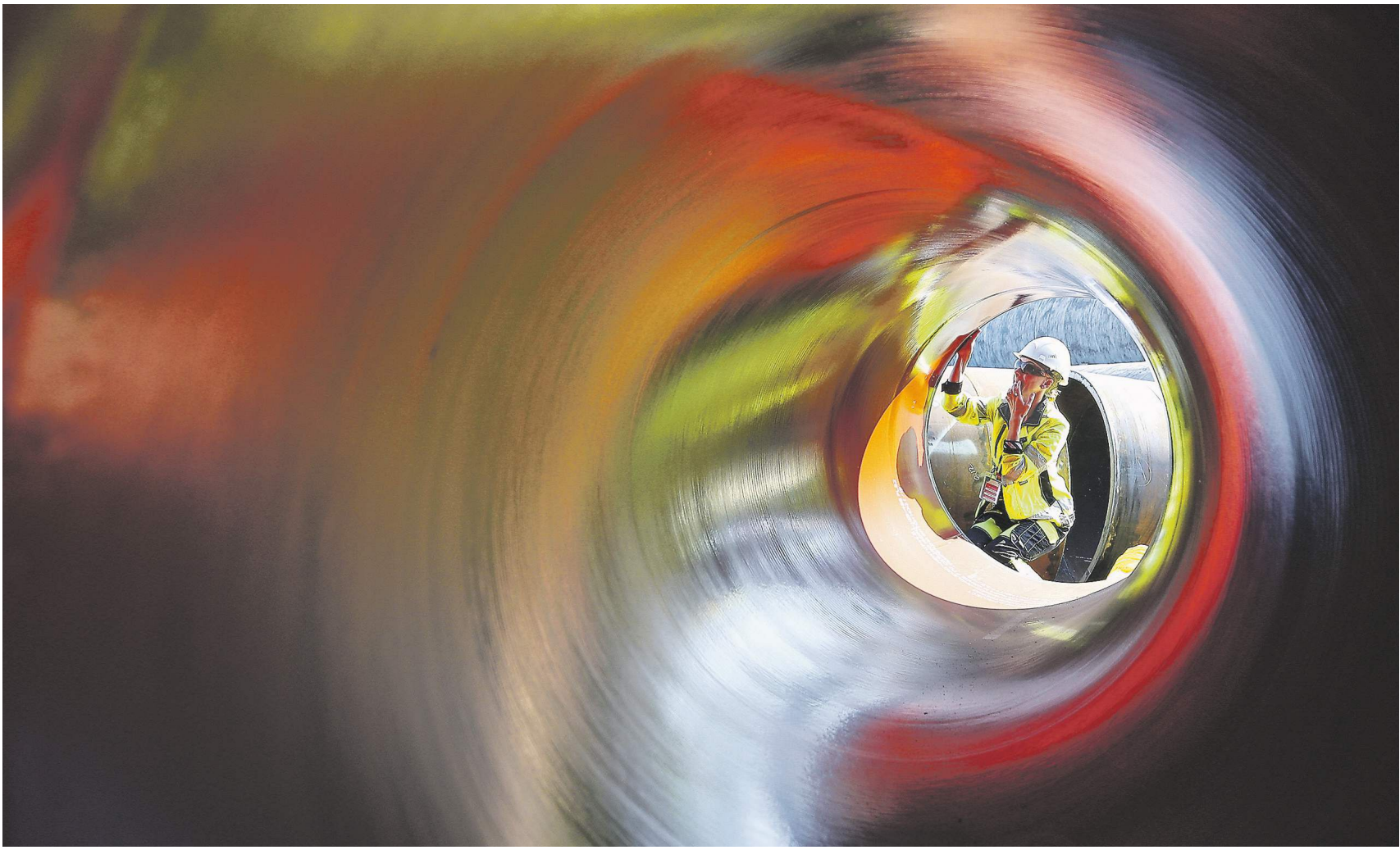
Падение зарубежных продаж изделий из металла отрицательно повлияло на статистику

Снижение зависимости России от продажи углеводородов и попытки слезть с нефтяной иглы, которые предпринимаются правительством последние несколько лет, забуксовали. Несырьевой неэнергетический экспорт товаров (ННЭ) из России сократился на 4,7% в первом полугодии 2019 года по сравнению с тем же периодом 2018-го и составил $67,1 млрд. Об этом говорится в отчёте, подготовленном департаментом аналитического сопровождения внешнеэкономической деятельности Минэкономразвития. Сильнее всего снизился экспорт пшеницы, стальных полуфабрикатов, изделий из чёрных металлов и летательных аппаратов. Наибольший рост показали платина, необработанный алюминий, оружие и боеприпасы, следует из документа.