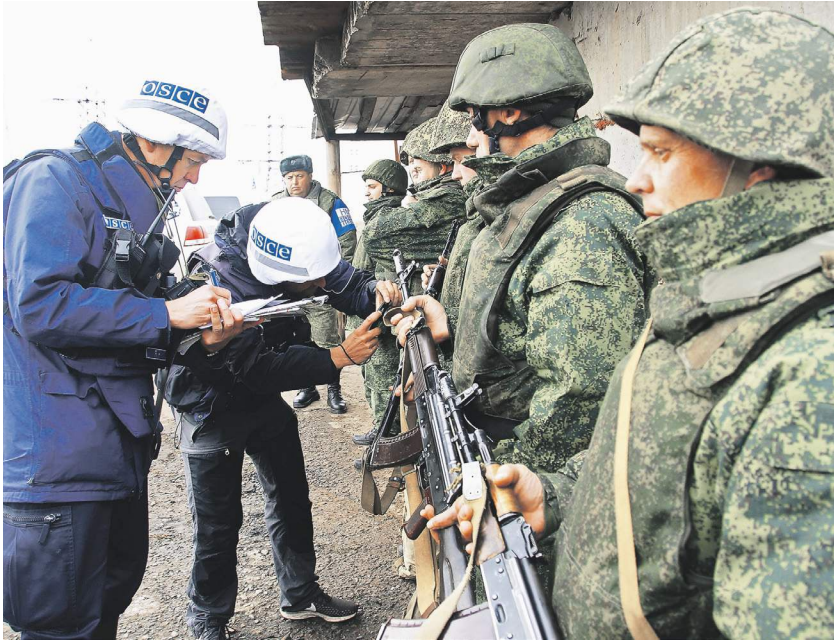
Наблюдатели ОБСЕ проверяют готовность подразделений ЛНР к разведению

Киев пытается вытеснить радикалов из Петровского