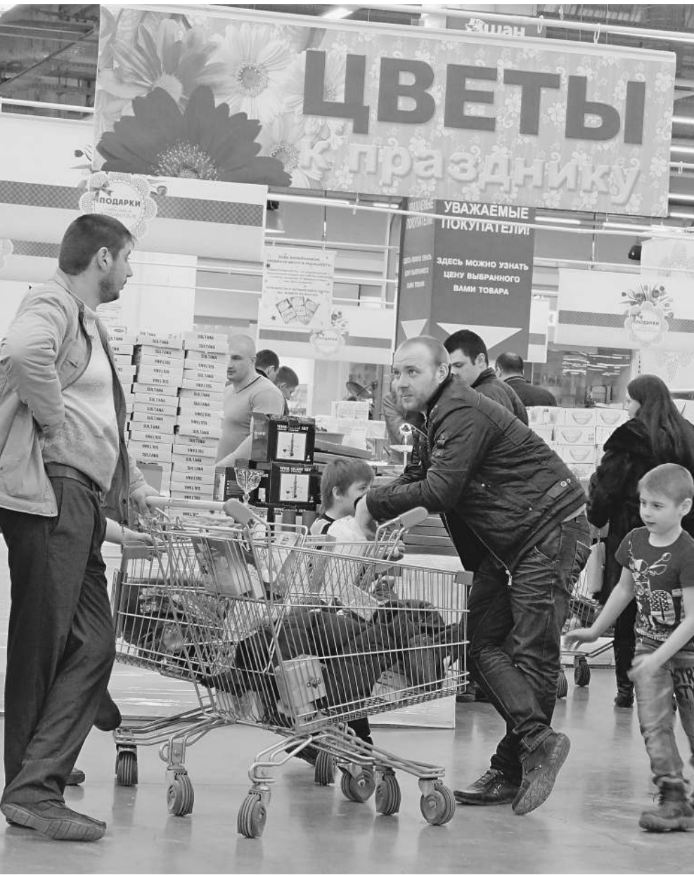
Магазинам станет сложнее вводить в заблуждение неискушенных покупателей