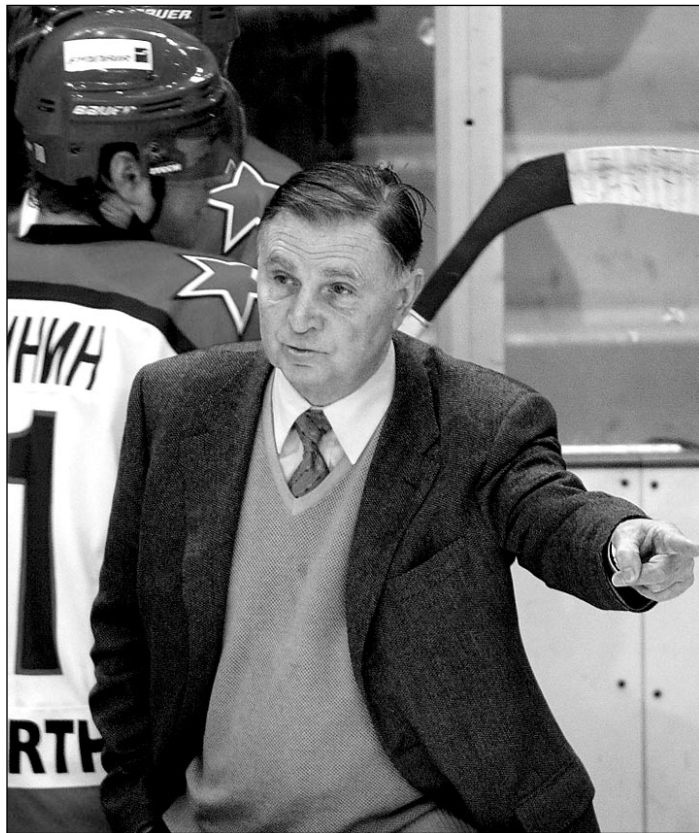
2004 год. За 27 сезонов в ЦСКА Виктор ТИХОНОВ не утратил ни проницательности, ни азарта.

Вчера главный тренер ЦСКА и сборной России Виктор Тихонов сделал заявление для «СЭ»: «Я принял решение полностью сосредоточиться на работе с национальной командой, в связи с чем ухожу с поста главного тренера ЦСКА. В то же время остаюсь президентом клуба и продолжу работу с армейцами в качестве тренера-консультанта».