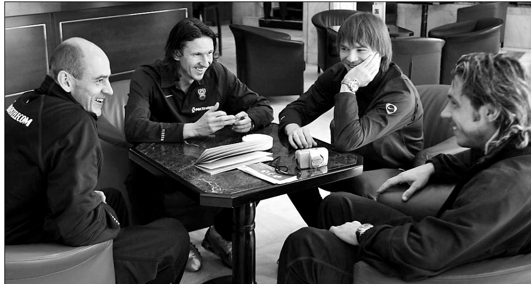
Вчера. София. Отель «Кемпински». Ветеранам нашей сборной - (слева - направо) Виктору ОНОПКО, Алексею СМЕРТИНУ, Дмитрию ЛОСЬКОВУ и Александру МОСТОВОМУ есть что рассказать друг другу.