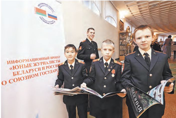
Победителей конкурса принимали у себя в училище московские суворовцы.

АНОНС / «СОЮЗ» побывал в кубанском Тимашевске в гостях у лауреатов фестиваля Союзного государства