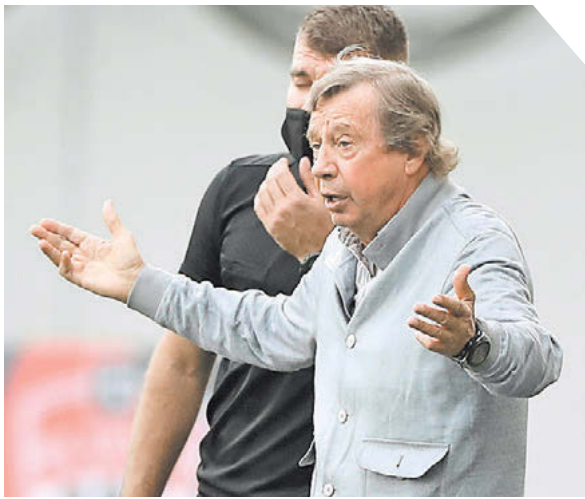
Александр Федоров «СЭ» / Canon EOS-1DX Mark II