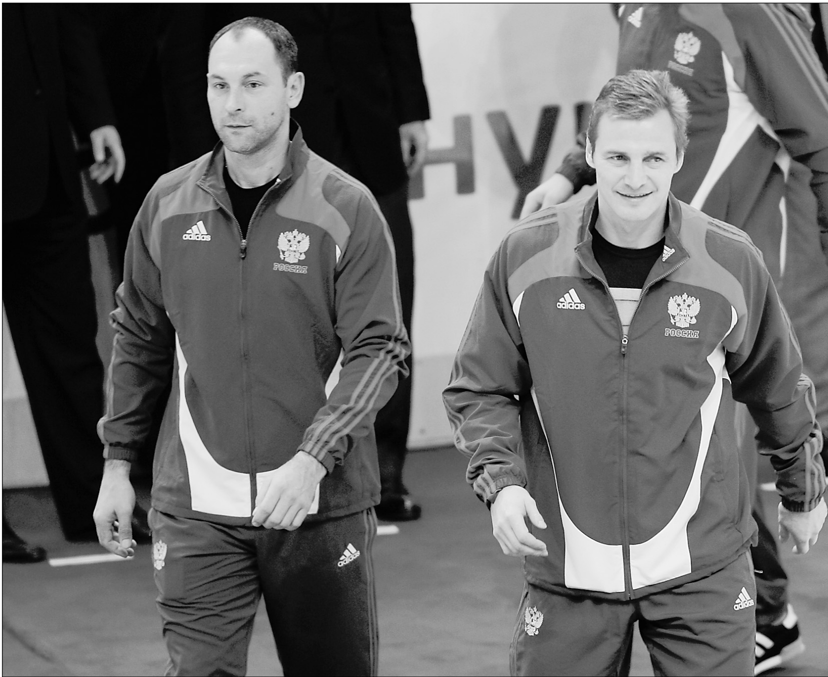
31 августа 2009 года. Москва. ДС «Мегаспорт». Преолимпийский сбор. Сергей ЗУБОВ (слева) и Сергей ФЕДОРОВ.

В итоге знаменитый ветеран не попал в основной состав национальной команды - список 23-х олимпийцев. Как стало известно «СЭ» несколько дней назад, Zubov вместе с еще пятью игроками включили в ближайший резерв сборной. Планировалось, что резервисты отправятся в Ванкувер 11 февраля.