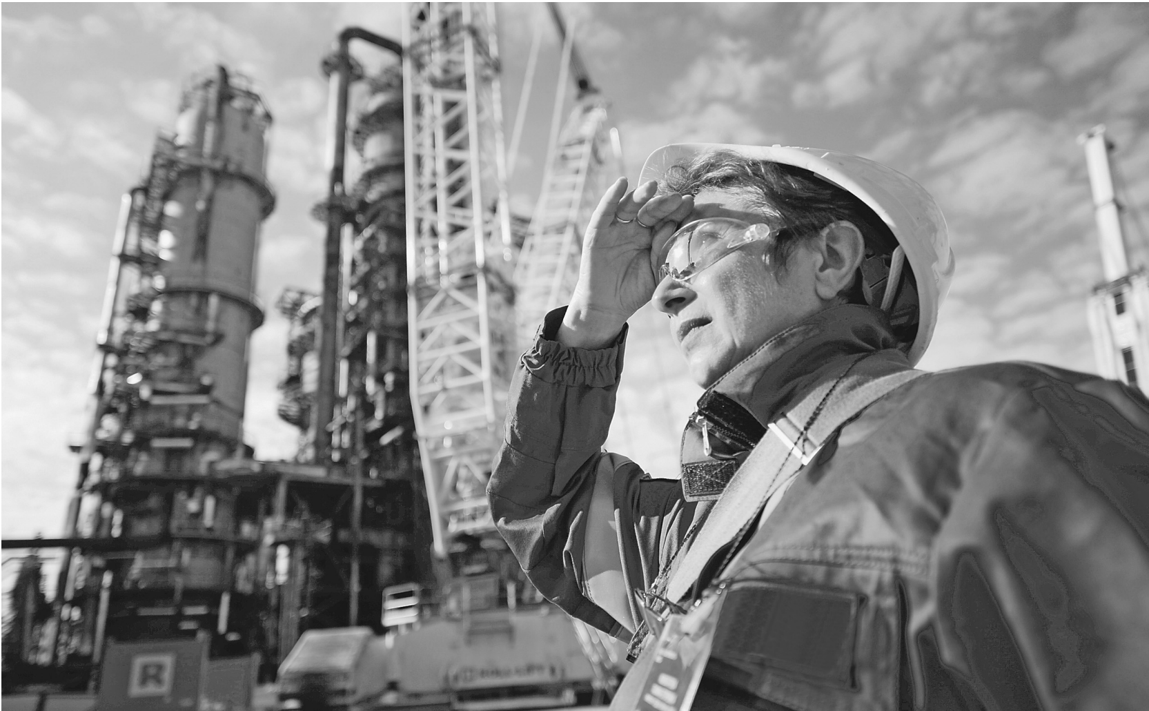
Старт ремонта нефтеперерабатывающего завода передвинули с начала на конец сентября