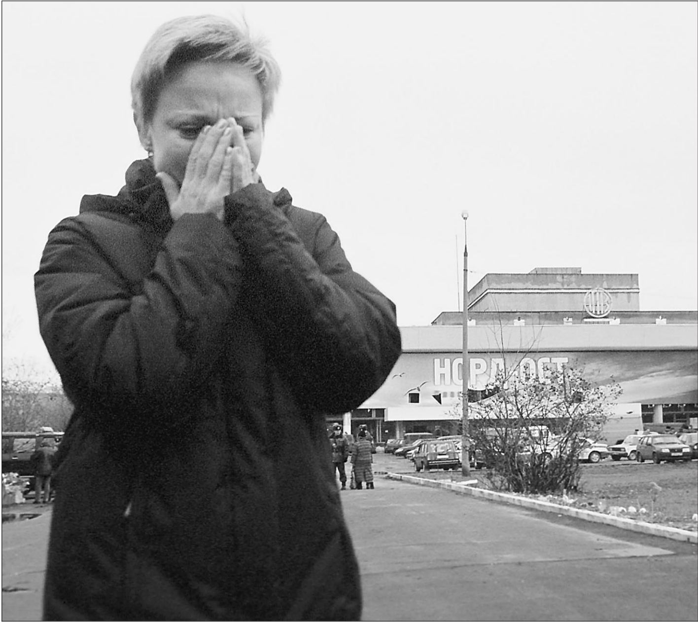
Площадь перед зданием театрального центра на Дубровке. Сразу после освобождения заложников