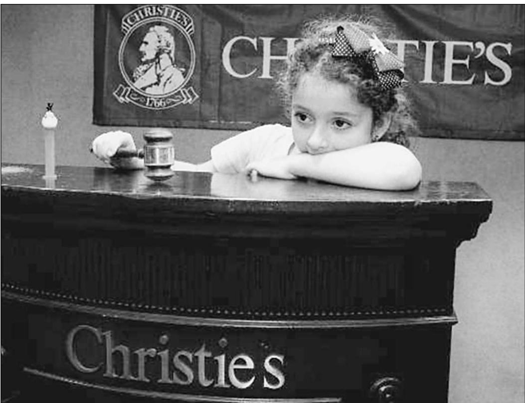
... и воспоминание (на знаменитых аукционах можно купить историю по сходной цене)