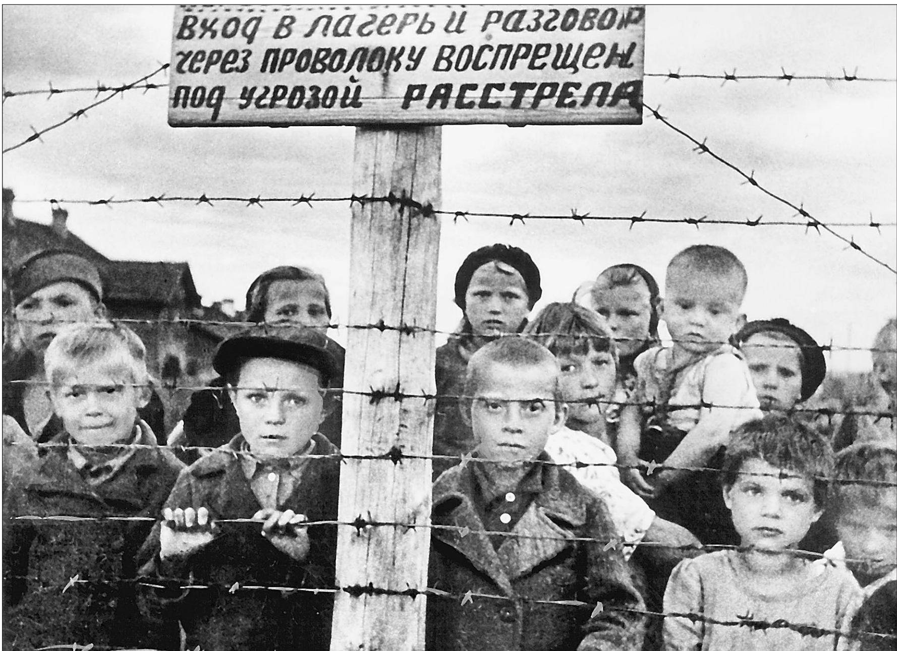
Так выглядел детский концлагерь в Петрозаводске 60 лет назад

Острые шипы проволоки, за которые нет-нет да и зацепится брочками какой-нибудь грибок, — единственное, что сегодня напоминает потомкам о тех событиях. В течение многих десятилетий тема эта замалчивалась исторической наукой, документы таились за семью печатями, и о