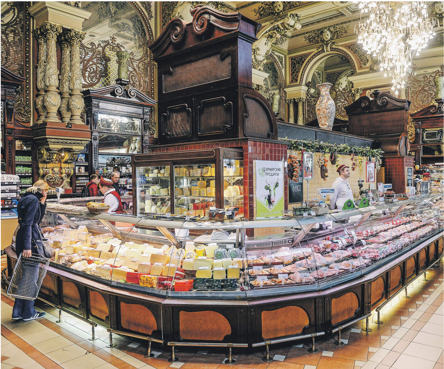
Сотрудники гастрономов по-прежнему будут обязаны проходить регулярные медосмотры