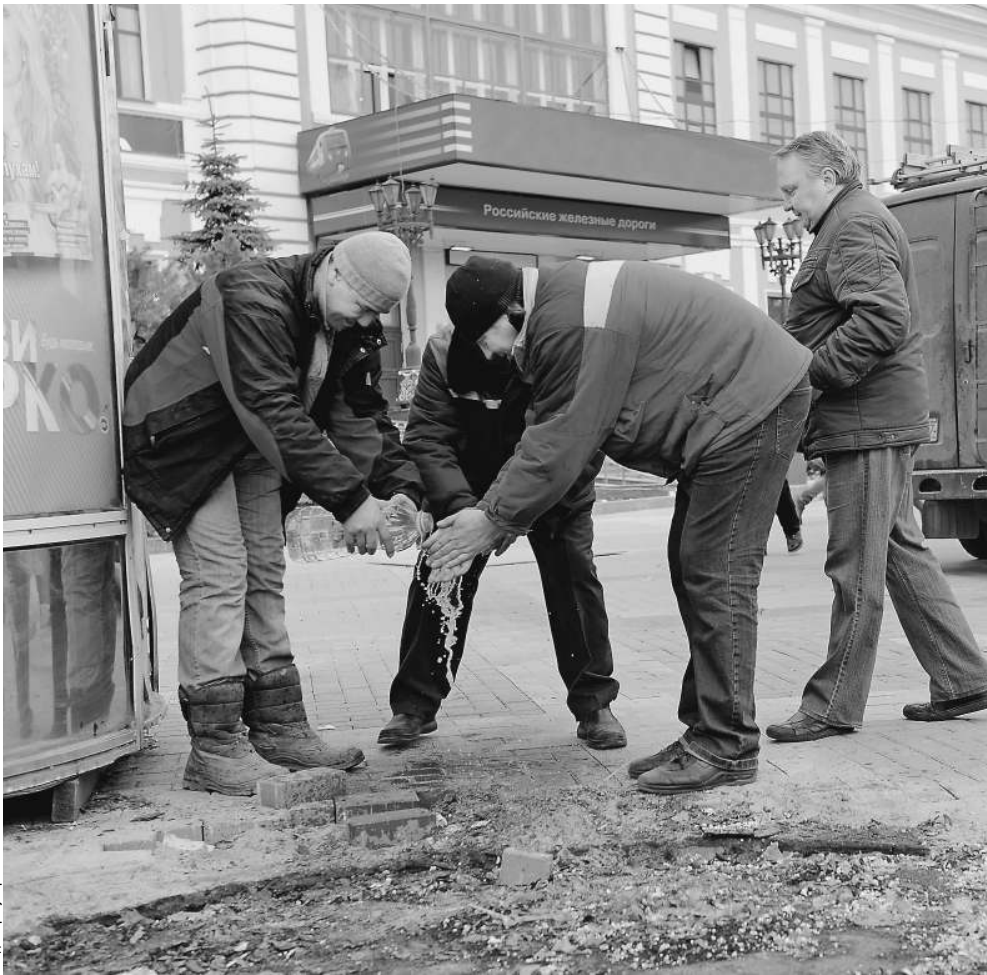
Снятие отпечатков пальцев недолго позволяло контролировать человеческие потоки