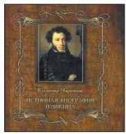
Марочкин В. Истинная биография Пушкина. Ростов н/Д.: Феникс, 2010. — 224 с.