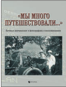
Лаврентьева Е. «Мы много путешествовали...»: Путевые впечатления в фотографиях и воспоминаниях. М.: Этерна, 2010. — 488 с.

6 «Дорогая Женечка! Спасибо за восточку». Вот именно это, только с картинками, представлял нам в данном альбоме. Нью-Йорк еще без небоскребов, подробная карта Баден-Бадена, пейзажи Швейцарии. «Барин ругает кондукторов мошенниками и эксплуататорами», — все так мило, что, оказывается, правда. А сейчас совсем не так.