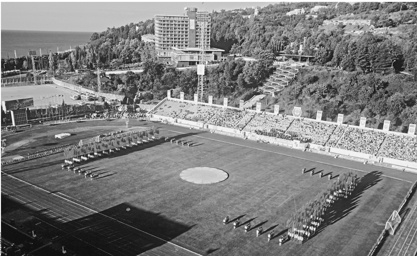
Бывший пионерский лагерь, а ныне детский центр «Орленок» ждет радикальная модернизация