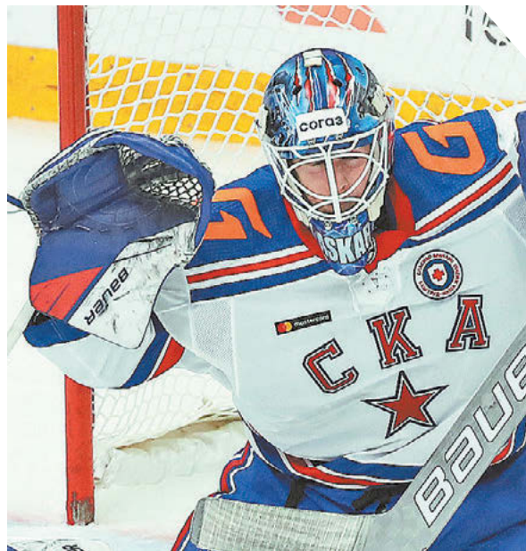
Александр Федоров «СЭ» / Canon EOS-1DX Mark II