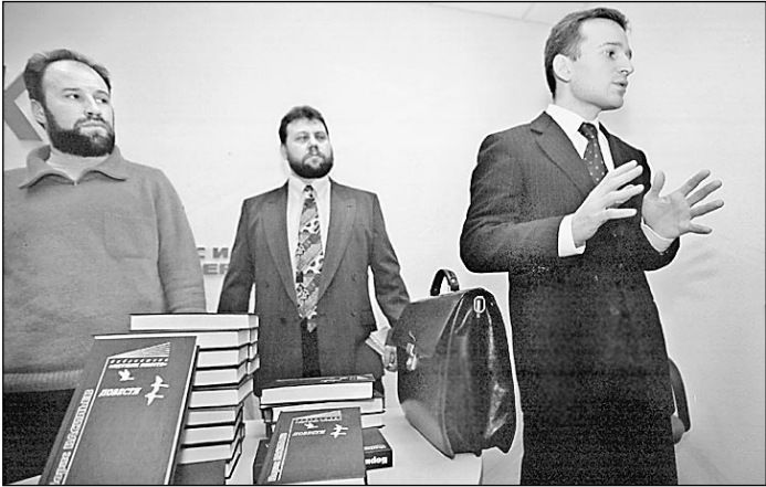
«Идущие вместе» пока не торгуют книгами

— Единственная причина, по которой откладывается акция, — та, что мы не имеем морального права игнорировать отношение к ней Бориса Васильева, — сказал Василий Якеменко. — «Известия» просто исказили информацию и настроили писателя против нашей акции. Мне пришлось поехать к Борису Васильеву и просить официальный документ о том, что акция была с ним согласована. Мы согласовывали именно обмен книг. А если Борис Львовичу не нравится, что его книга будет использоваться для обмена, мы передадим ее библиотекам. Через две недели напечатает другую книгу и все равно проведем эту акцию. Это