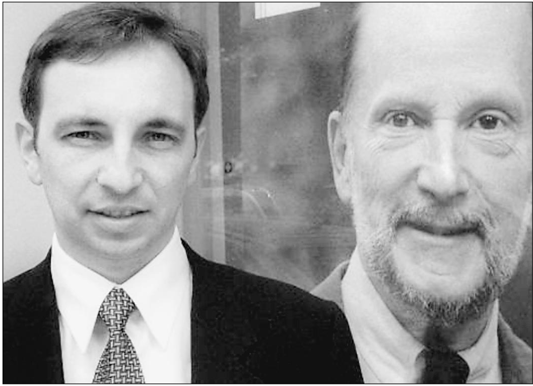
Вице-премьер, министр экономики Болгарии Николай Василев на фоне бывшего болгарского короля Симеона

Доходы от ядерных отходов сгинули в Бермудском треугольнике