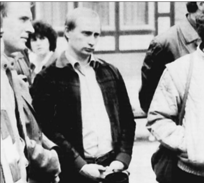
Коллеги считали Владимира Путина «добрым разведчиком»

— А как в свете его антикоммунизма можно оценить сотрудничество с режимами, которые больше, чем просто коммунистические, где о праве — хоть с большой, хоть с маленькой буквы — и речи быть не может: Лукашенко, Каримов, Ниязов? Как это сочетается с вашими характеристиками Путина?