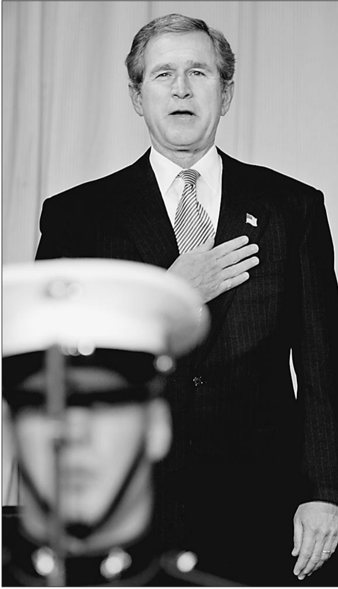
Джордж Буш готовится к победе

Обращает на себя внимание то, что растущий оптимизм относительно поддержки России Америка стала проявлять после телефонного разговора на днях Путина с Бушем. Он состоялся сразу после отъезда из Москвы Шредера. Встреча канцлера с Путиным была отмечена, с одной стороны, поддержкой Москва мирного варианта урегулирования иракской проблемы, с другой — примечательными (тем более что сделаны