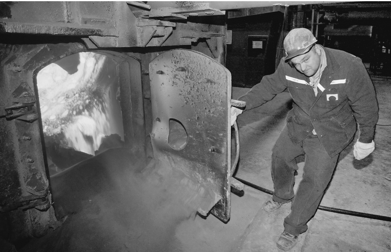
В Пикалево опять наступают горячие деньки