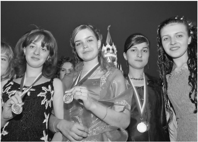
Минобрнауки сэкономит на благородном металле