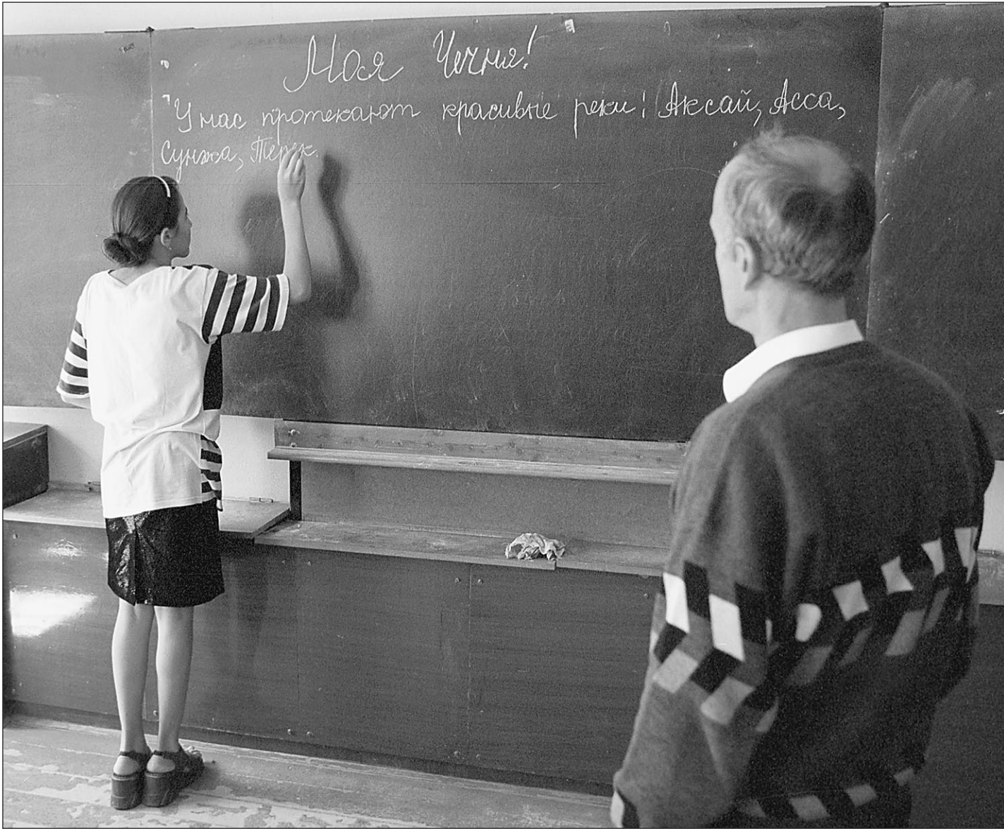
Чечня: урок мира