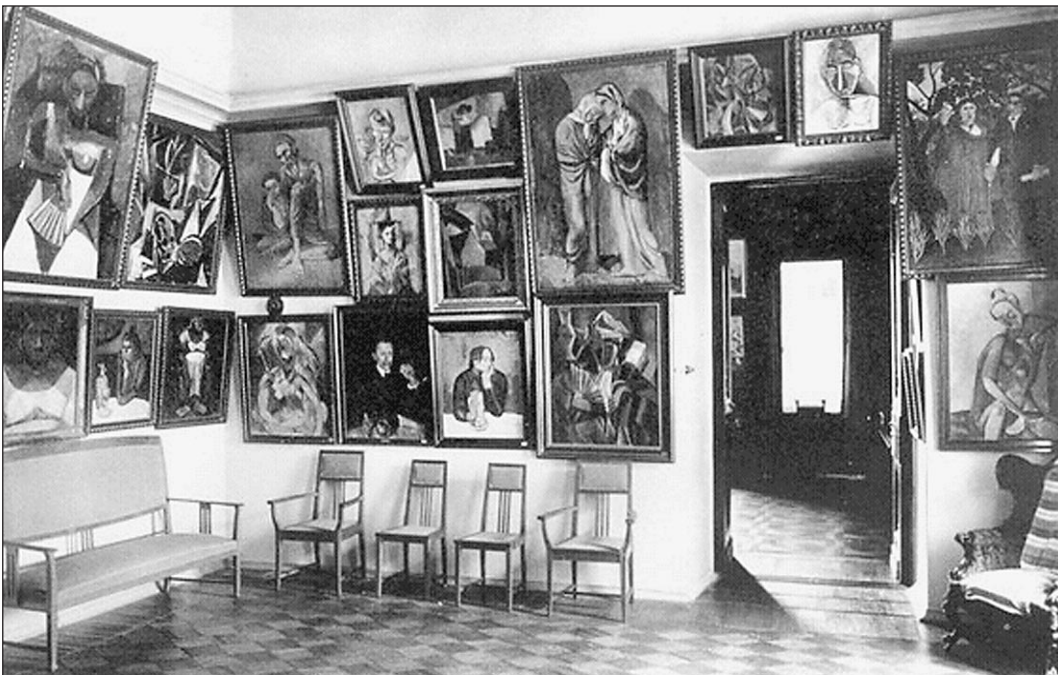
Фото 1910 года. Салон Щукина в Москве. На стенах — полотна Пикассо и других знаменитых художников

— В данном случае цель иска не вернуть картины, а помешать их