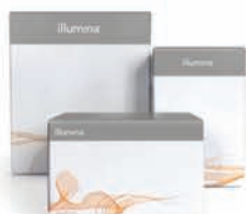
Наборы реагентов для секвенирования

№ РЗН 2020/13097, № РЗН 2020/13162, № РЗН 2020/13163