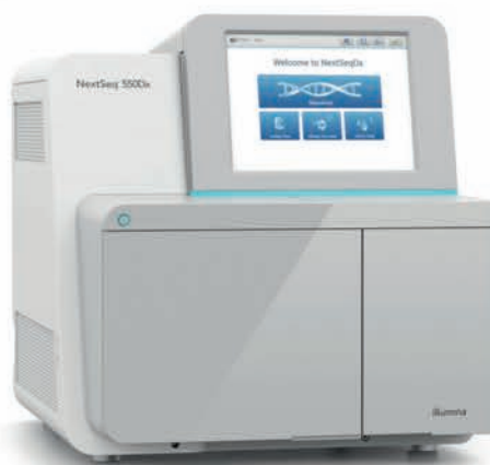
NextSeq 550 Dx

Секвенатор NextSeq550 Dx - идеальный прибор для реализации проектов централизованного тестирования.