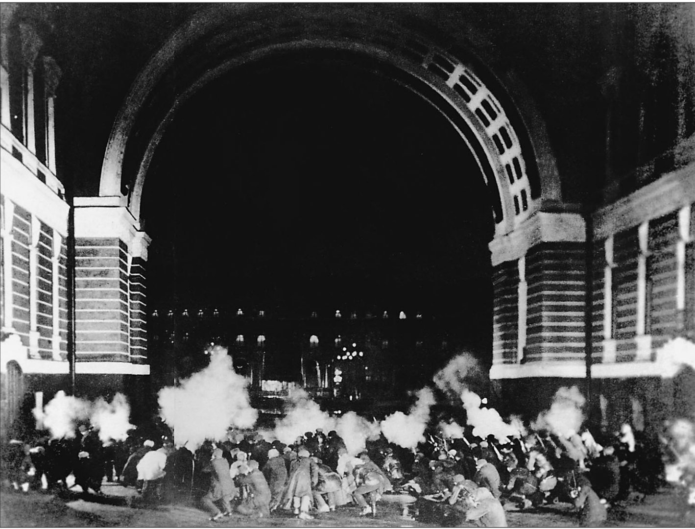
1917 год. Октябрь. Штурм Зимнего дворца

Социологов можно понять, они высвечивают настроения общества. Но вот вопрос: они всегда лишь отражают настроения общества и никогда не формируют их самой постановкой вопроса? А если нет, то должны ли они и вправде ли они это делать? Вот, например, недавний опрос РОМИР-мониторинга на тему олигархов и необходимости пересмотреть итоги приватизации. В такой постановке (РОМИР-мониторинг, цитируется по официальном сайту) — «Как вы оцениваете роль крупных капиталистов («олигархов») в истории России 90-х годов?» — разве не содержится пусть слабая, но подказка посетователю человеку, коему со школькой вдалбливали, что капиталист — это буржуй проклятый, а олигархи вообще уже можно пугать детей в последнее десятилетие? Почему, например, не нашлось более нейтральных терминов — «крупные