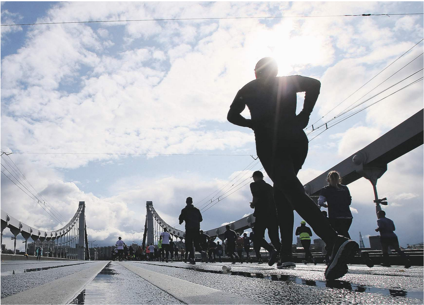
Александр Кавалев / Иллюстрация