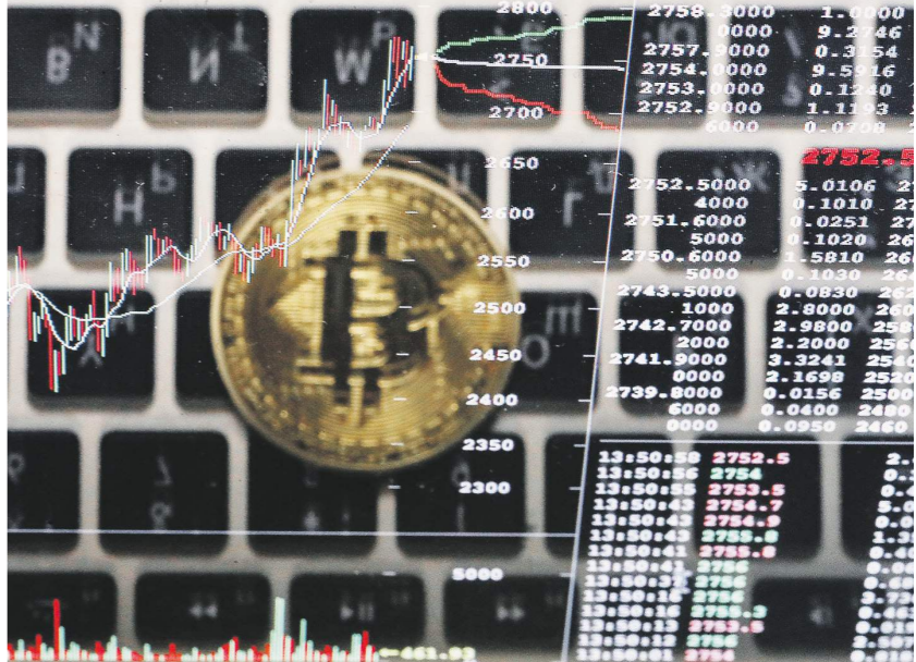
Виктория Прохорова / ИАСС