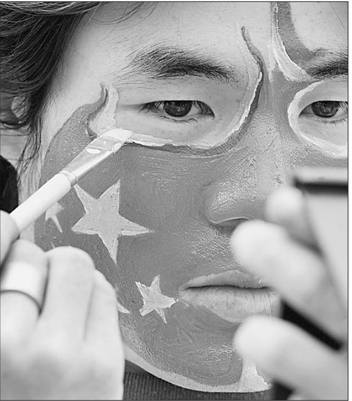
Китай с демократическим лицом