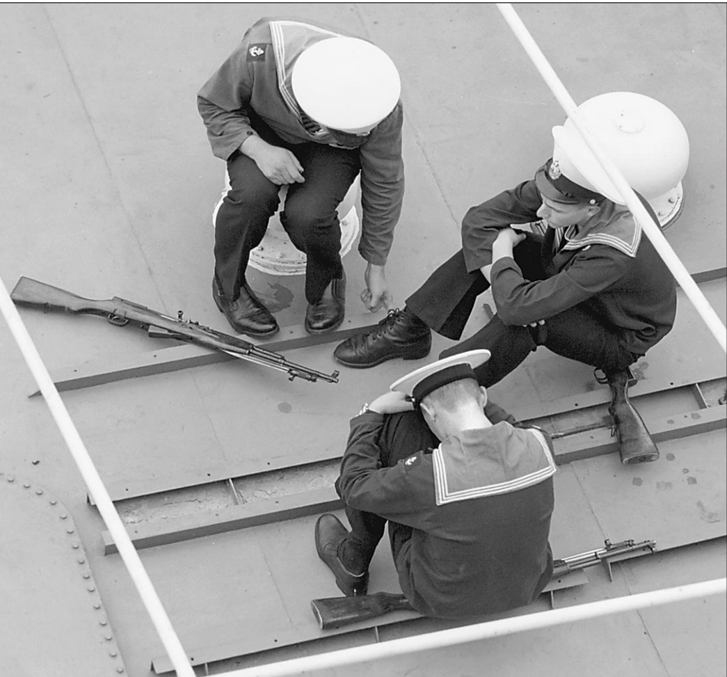
Члены экипажа авианосца «Адмирал Горшков»

По разным причинам российские самолеты вертикального взлета в серию не пошли и были сняты с вооружения. Как говорят специалисты, произошло это из-за того, что при взлете и посадке машины имели очень низкую