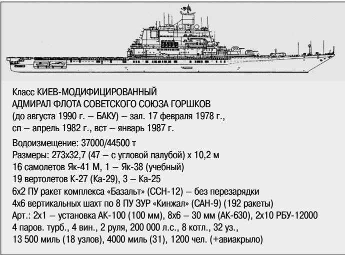
Тактико-технические характеристики авианосца «Адмирал Горшков»

Контракт о передаче Дели тяжелого авианесущего ракетного крейсера (ТАКР) «Адмирал Горшков» может быть подписан в ходе официального визита в Россию министра обороны Индии Дхорджи Фернандеса. По условиям сделки Москва безвозмездно — то есть даром — передаст корпус крейсера индийской стороне. Взамен Дели оплатит работу по переоборудованию крейсера в полноценный авианосец на российской кораблестроительной верфи и заодно купит партию палубных истребителей МиГ-29К. В итоге, по оценкам экспертов, сумма сделки может превысить $2 миллиарда.