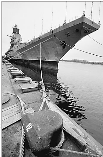
Авианосец «Адмирал Горшков»

Москва дарит Дели осколок «холодной войны»