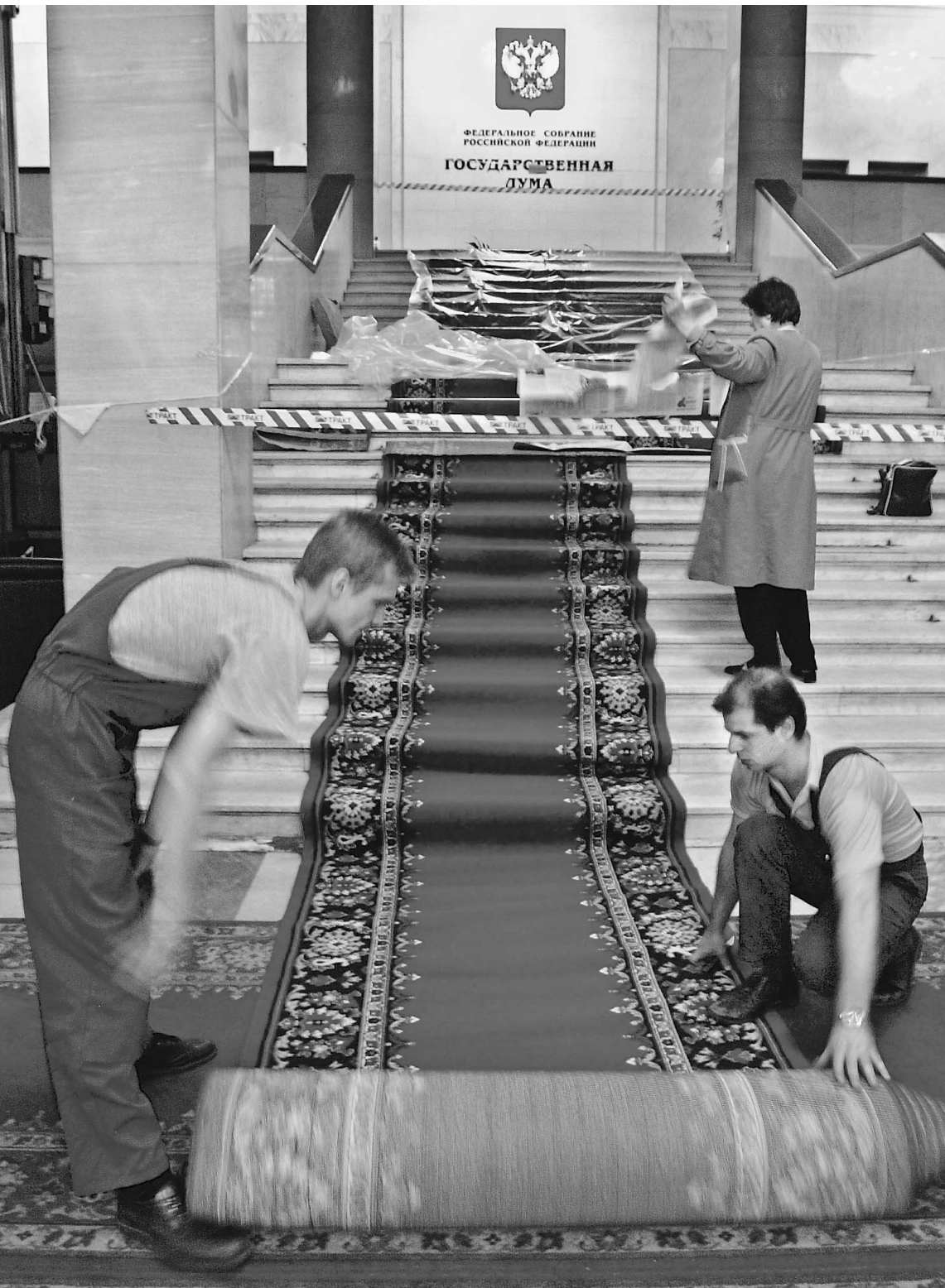
Двери парламентов могут открыться и перед теми, кто недобрал голосов на выборах

В Кремле определяют основные черты политической реформы