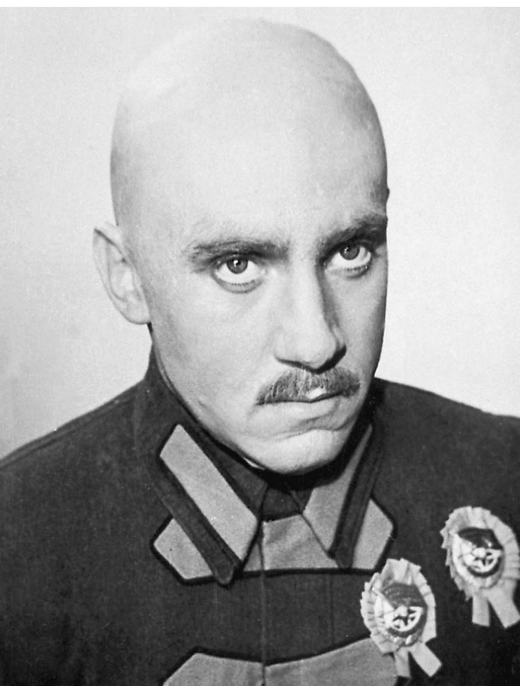
Кинопроба к фильму «Маршальская звезда»

25 января Владимиру Высоцкому исполнилось бы 72 года. Накануне дня рождения великого барда «Первый канал» покажет 13-ю церемонию вручения премии «Своя колея».