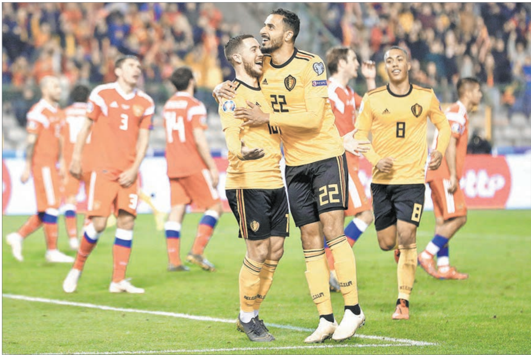
Вчера. Брюссель. Бельгия - Россия - 3:1. 88-я минута. Насер ШАДЛИ (№ 22) поздравляет Эдена АЗАРА с голом.

Вчера сборная России в стартовом матче отборочной кампании Евро-2020 проиграла Бельгии (1:3). Следующий матч уже в воскресенье - с Казахстаном, который дома разгромил Шотландию (3:0).