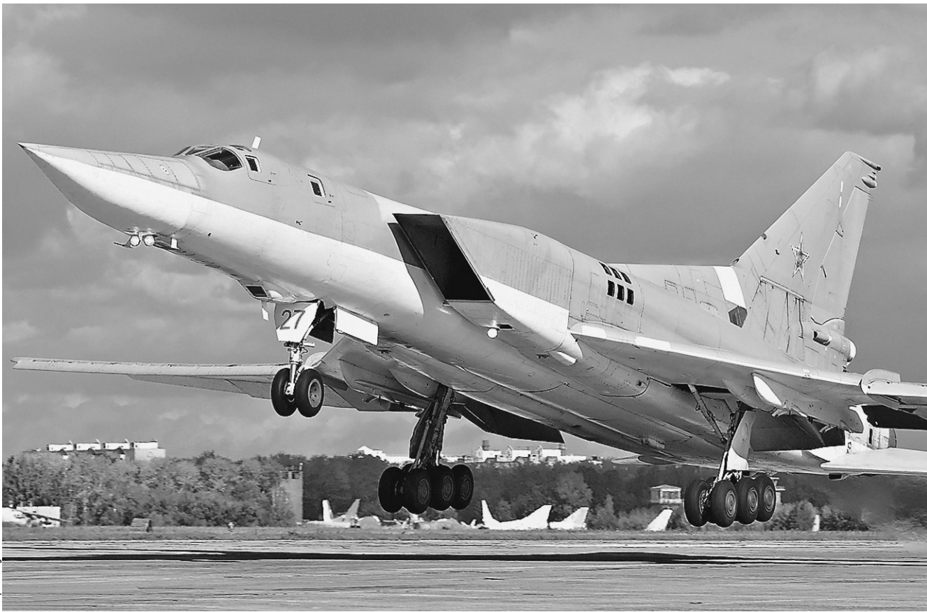
После второй модернизации Ту-22М3 опять станет современным оружием